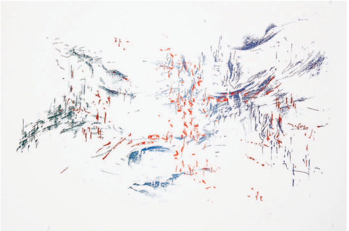
iberia - el puerto